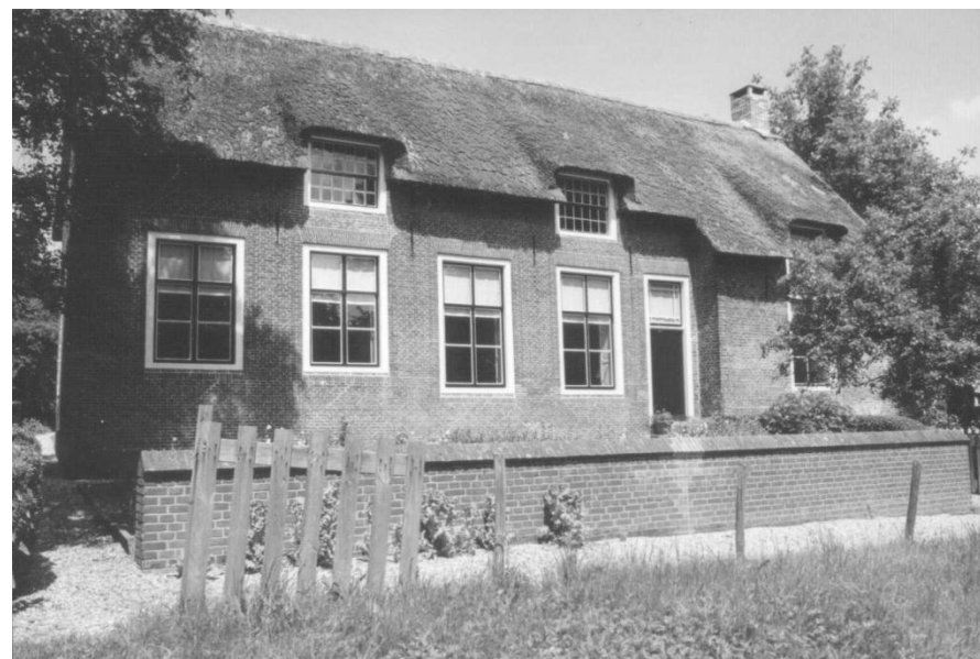
Boerderij aan de Flegelstraat 1 te Brakel.