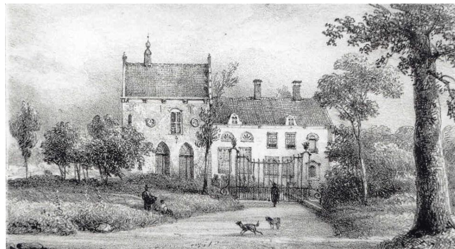
Het Spijker in de 18 e eeuw.