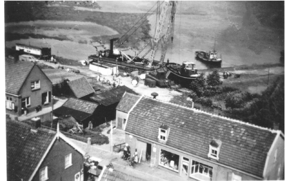
Op de voorgrond de oude smederij van Teeuwen aan de Waaldijk