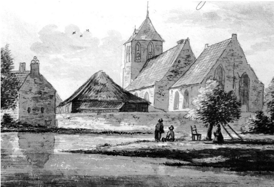
Poederoyen, tekening –penseel ("Collectie Gemeentemuseum Arnhem")

Bij velen is bekend dat de bevolking van Brakel door de bezetters naar het marktplein gejaagd was en vele uren met de dood bedreigd werd. Uit het feit dat ik het na 45 jaar nog de moeite vind om dit op te schrijven, blijkt wel dat het diepe indruk heeft gemaakt. Als onderduiker, zoals ik toen nou eenmaal genoemd werd, was er voor mij weinig bewegingsruimte meer. Ik hoorde toevallig tot de verplichte lichte 1923 die in zijn geheel als arbeidsslaaf in Duitsland ingezet zou worden. Alles werd nog ondernomen om een zogenaamd 'Ausweis' te bemachtigen, vooral door aan te dringen hoe belangrijk landarbeiders waren, die werkten aan de voedselvoorziening. Maar uiteindelijk was de oorlogsindustrie in Duitsland toch belangrijker. Na nog vele malen in Tiel en Nijmegen op het arbeidsbureau geweest te zijn, moest ik op de afdeling migratie verschijnen om de nodige bescheiden in ontvangst te nemen.