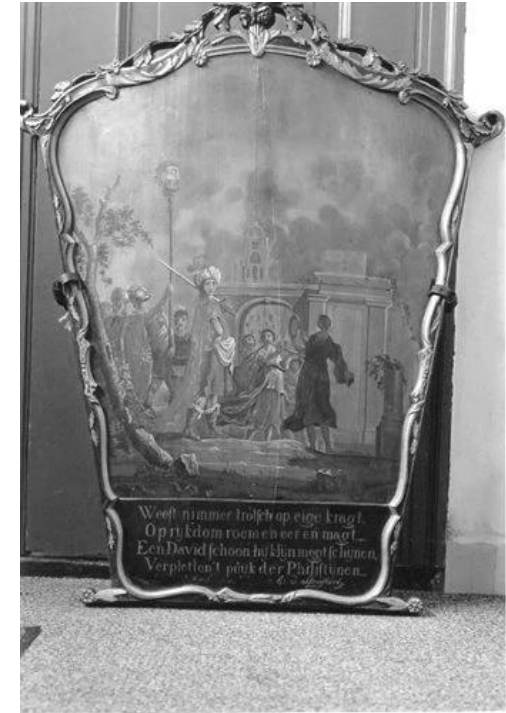
Hoog krat met de afbeelding van David en Goliath. (Stadskasteel, Zaltbommel)