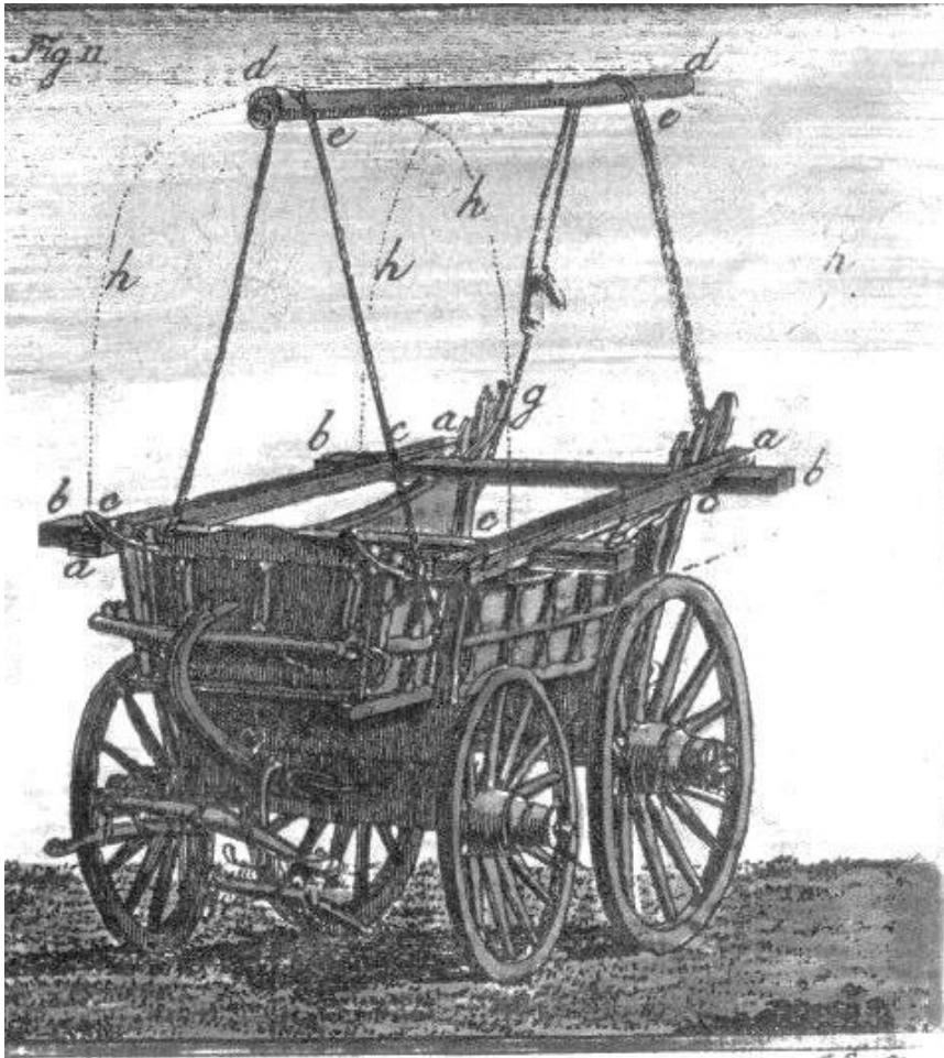
Boerenwagen uit de 18 e eeuw.