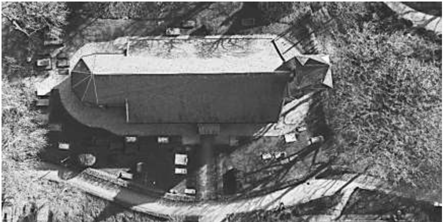
De kerk van Brakel met de graven van bovenaf gezien.

Door vrijwilligers van de dorpsraad in Brakel zijn afgelopen jaar de graven rondom de hervormde kerk in Brakel schoongemaakt. Bij enkele kindergraven hebben we informatie kunnen achterhalen. We doen u hierbij verslag.