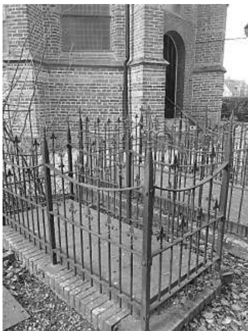
De ingang van de kerk onder de toren met het graf van Adriaan Poot.