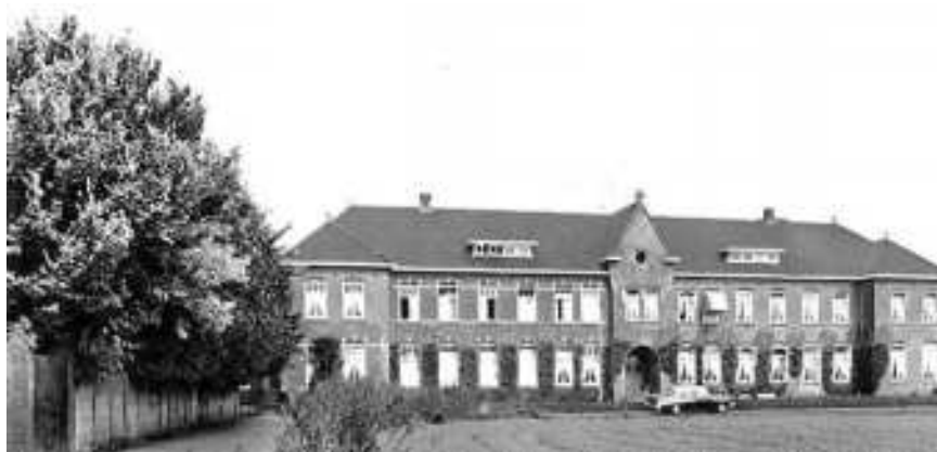
Het internaat, St. Antoniushuis in Acht.

broers het daar niet zo naar hun zin bij de nonnen, want erg lang hebben ze het daar niet volgehouden en zijn vervolgens in de buurt naar school gegaan.