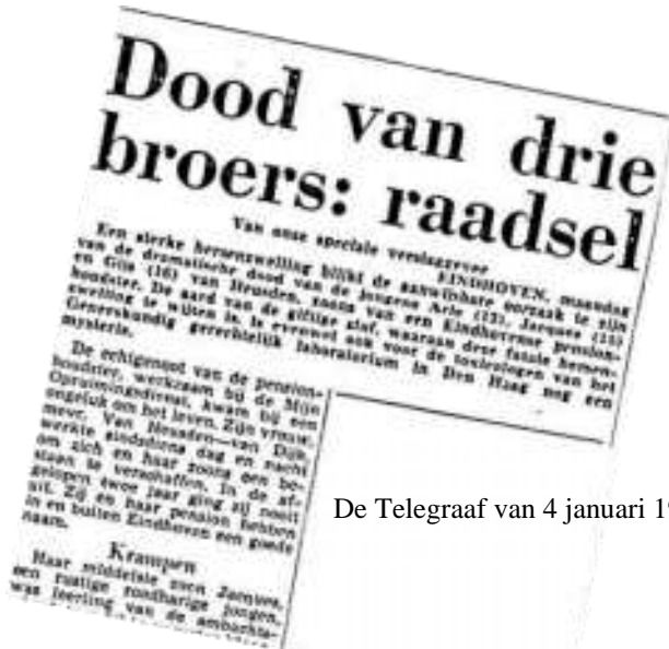
De Telegraaf van 4 januari 1960

De landelijke kranten, maar ook veel regionale kranten kwamen op maandag 4 januari 1960 met een bericht over de mysterieuze dood van de drie Eindhovense jongens.