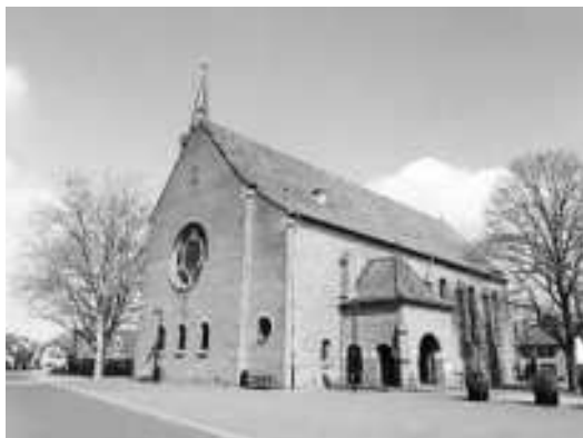
De naoorlogse H. Michaëlkerk in Wanssum, gebouwd in 1950.

Ook al waren de kaarten al gedrukt, het werd dus géén trouwen!