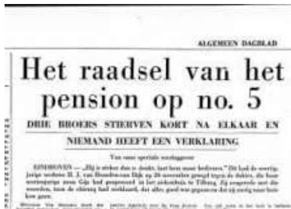
Algemeen Dagblad van 8 januari 1960