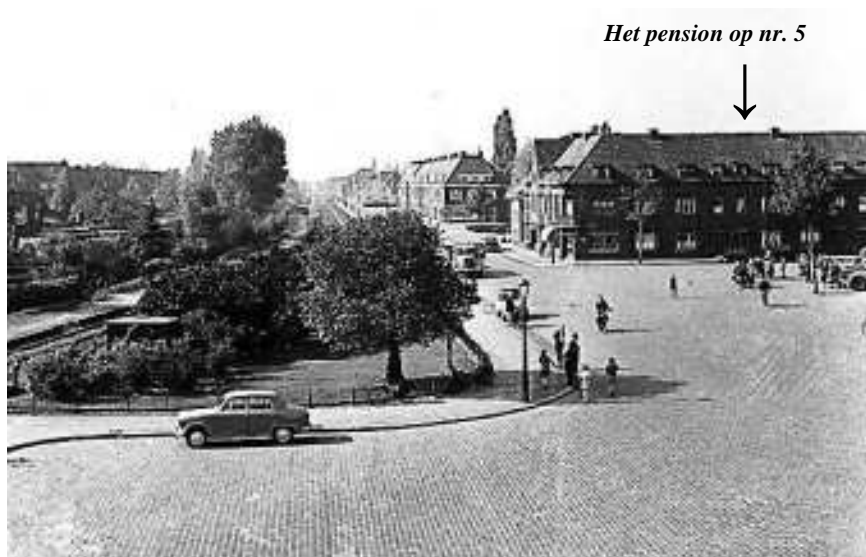
Het Lodewijk Napoleonplein in Eindhoven met geheel links het spoorlijntje naar België en in het midden de Hagekampweg. Rechts het pand met het pension op nr. 5.

En ook 'Ome Nico' zoals hij genoemd werd door de jongens, was onder-tussen naar Eindhoven gekomen en had onderdak in het pension gevonden.