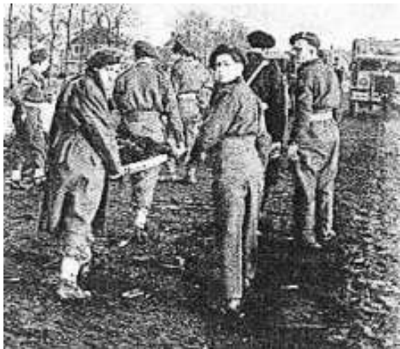
Het bergen van de slachtoffers.

Het was op 17 januari 1947 om 7 minuten over één in de middag dat er in Muiden op de Springstoffenfabriek De Krijgsman een verschrikkelijke ontploffings-ramp plaatsvond. Bij het uitladen van een transport dat bestond uit vier volgeladen trucks van de Opruimings- en Bergingsdienst uit Leiden met ongedemonteerde granaten, afkomstig van Duitse bunkers langs de kust en uit andere plaatsen is er iets fout gegaan. Deze granaten werden met de hand gelost door 15 militairen die ze elkaar doorgaven en op een lorrie legden. In de buurt waar dit gebeurde was ook nog een kruutmagazijn waar 500 kg springstof lag opgeslagen. Het lossen van de eerste truck verliep vlot maar bij de tweede truck ging het goed mis. Een granaat is waarschijnlijk te hard op de lorrie gelegd of is van de lorrie afgevallen en met de kop op de rails gevallen. De granaat ontplofte waarna de andere granaten op de lorrie ook ontploften. Hierop volgde een kettingreactie en de andere vrachtwagens en het magazijn gingen toen ook de lucht in. De uitwerking was verschrikkelijk. Het hele terrein en de omgeving lag bezaaid met granaten tot in de bebouwde kom van Muiden waar 342 woningen meer of minder beschadigd werden.