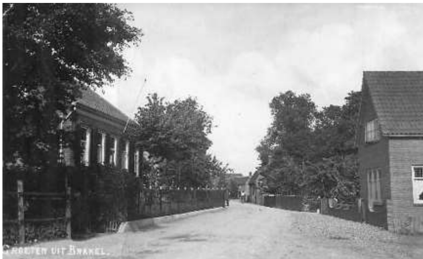
Links A115, nu is dit Burg. Posweg 16,