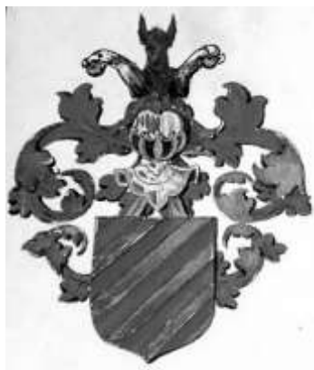
Wapen van de familie.